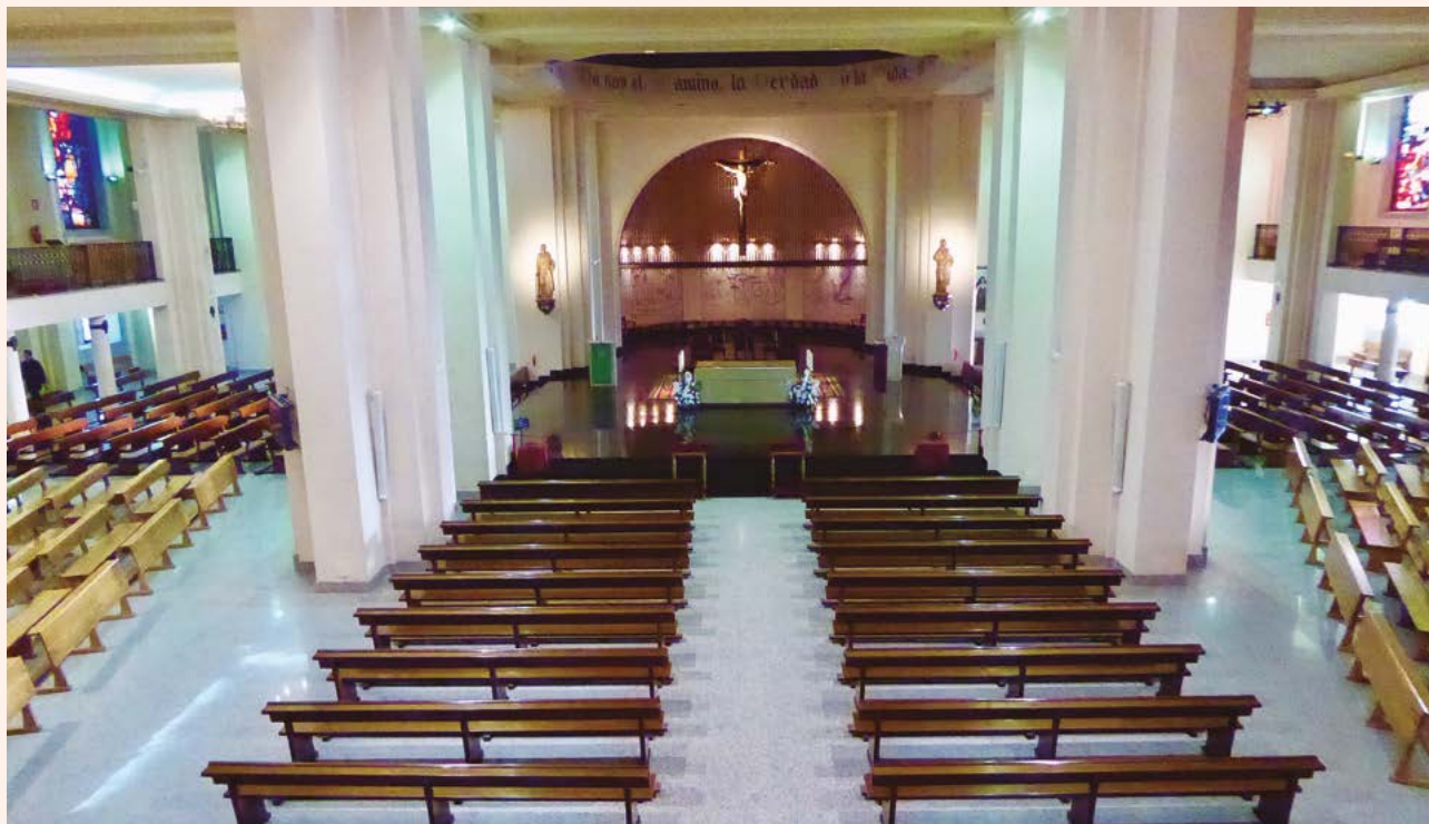
Vista del interior de la basílica del Sagrado Corazón, lugar de especial relevancia en la vida de la Diócesis de Getafe.