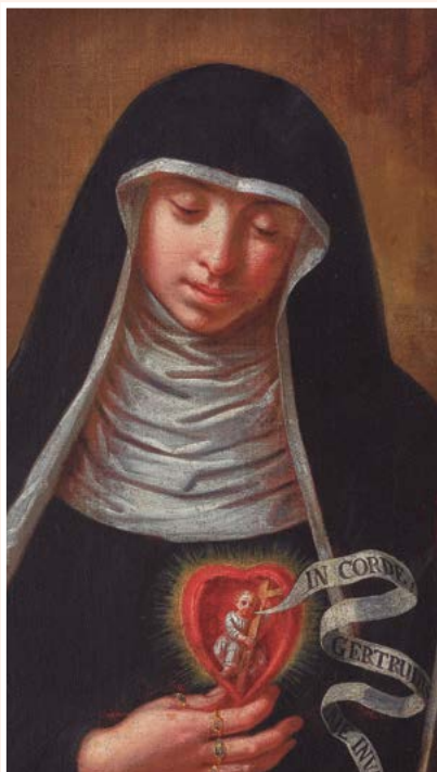
Santa Gertrudis la Grande.

Cuenta que Jesús “abrió la herida de su dulce Corazón y dijo: He aquí la grandeza de mi amor ”... Unió su dulce Corazón con el corazón del alma y le dio todas las prácticas de contemplación, devoción y amor. Después de la santa Comunión, anhelaba sólo la alabanza de Dios. Entonces, el Señor le dio su Corazón divino en