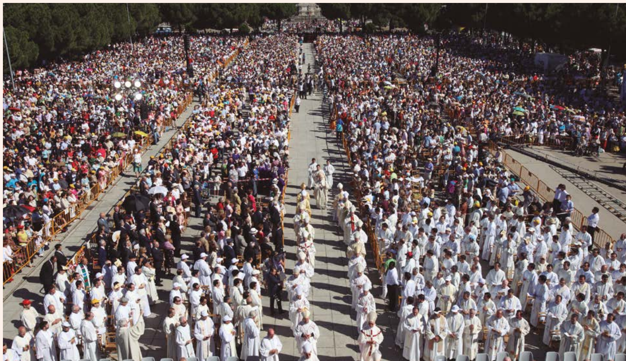
Así lucía la explanada del Santuario del Cerro de los Ángeles el 21 de junio de 2009, durante el 90º aniversario de la Consagración.