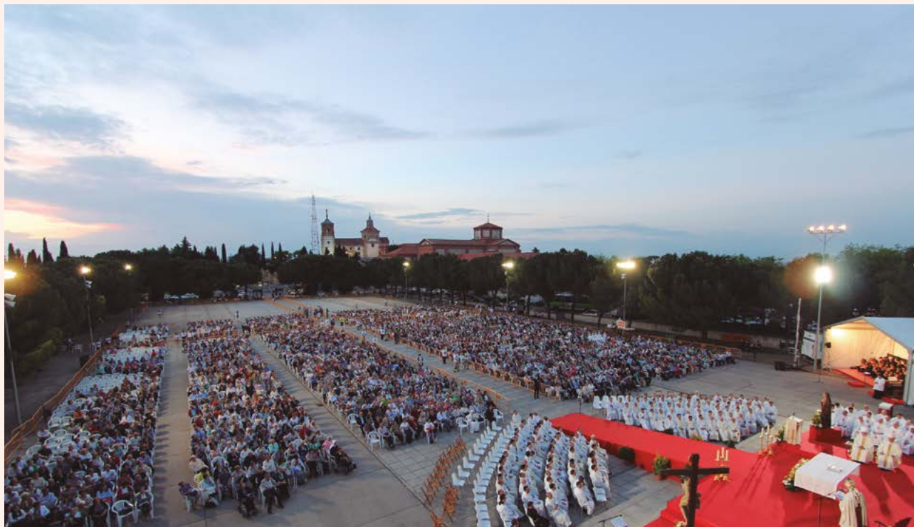
La basílica y la explanada del monumento al Sagrado Corazón serán el escenario principal de los actos de la renovación.