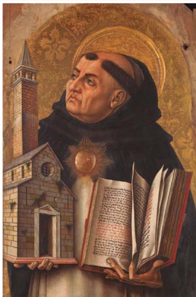
Santo Tomás de Aquino.

Dentro de la escuela dominica, destacaron los llamados místicos renanos. El Maestro Eckhart usó la metáfora del fuego para describir el amor del Corazón de Jesús. Dice que “fue completamente consumido por el fuego de su amor para todo el mundo”. Su discípulo, Juan Taulero dijo: “¿Qué más pudo hacer para nosotros que no ha hecho? Abrió su mismo Corazón para nosotros,