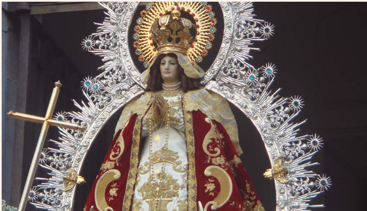
Imagen de la patrona de la Diócesis de Getafe.