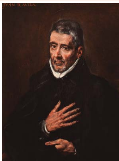
Retrato de san Juan de Ávila.

Sus famosos ejercicios espirituales concluyen con la meditación de la